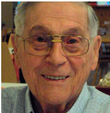
alt-Regierungsrat Rudolf Bachmann