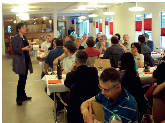
Abendessen im Sportzentrum «Moos»